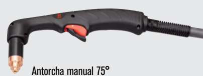
Antorcha manual 75°

(visitar www.hypertherm.com para más opciones de antorchas)