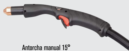
Antorcha manual 15°