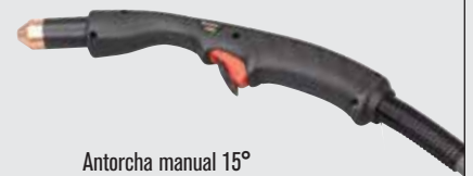
Antorcha manual 15°