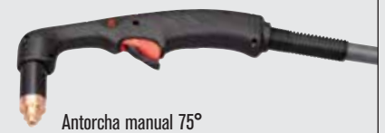
Antorcha manual 75°

Estilos estándar de antorchas Duramax (visitar www.hypertherm.com para más opciones de antorchas)