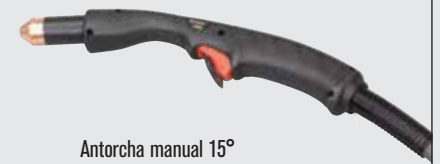
Antorcha manual 15°