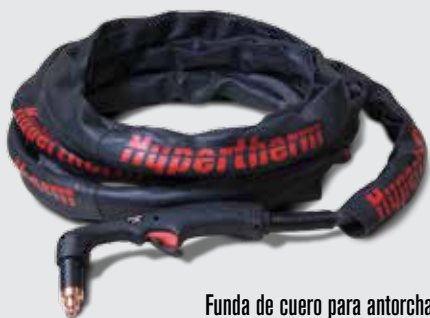
Funda de cuero para antorcha