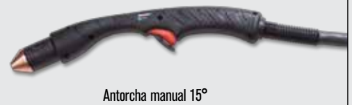
Antorcha manual 15°