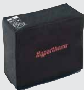
Cubierta contra el polvo para el sistema