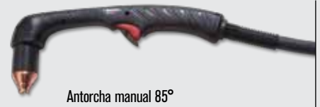
Antorcha manual 85°

(para ver más opciones de antorchas, visite www.hypertherm.com )